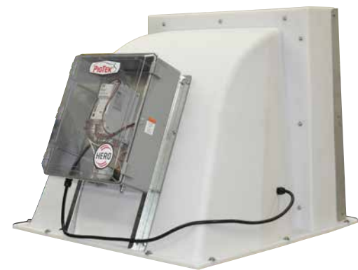
Ventilador de fosa PigTek HERO™ con propulsor de frecuencia variable (VFD) y transición