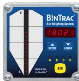
Indicador estándar (BT200)