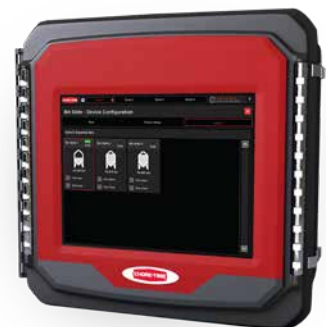
Acceso remoto a través del sistema PIGCENTRAL™