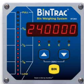
Indicador de 6 dígitos (BT260)