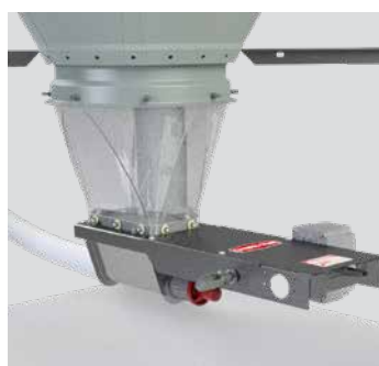
ACCIONADORES DE LA CORREDERA DE LA BOTA