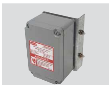
TEMPORIZADOR DE FUNCIONAMIENTO DEL SINFIN