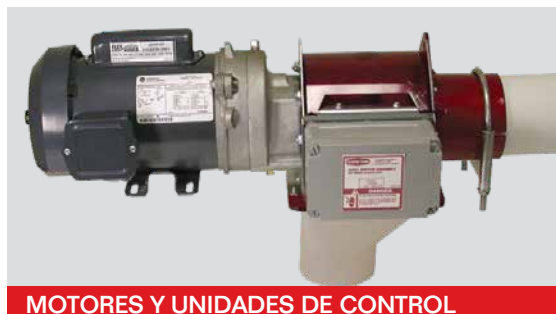
MOTORES Y UNIDADES DE CONTROL