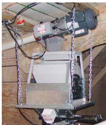
BALANZA DE TRANSPORTE DE ALIMENTO