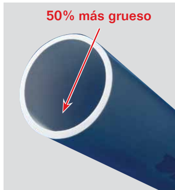
CODOS DE PVC CURVOS