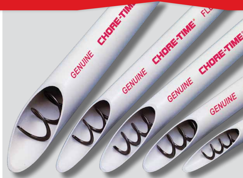
CINCO MODELOS FLEX-AUGER®