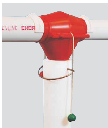
DESCARGA DE SALIDA