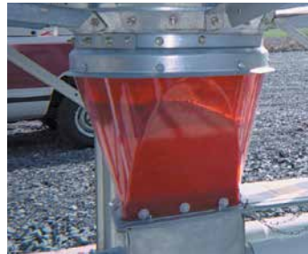
TRANSICIONES Y BOTAS