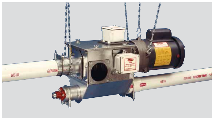
BOTA DE EXTENSIÓN PARA ALIMENTO