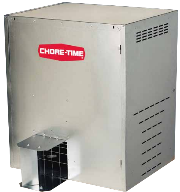
Calefactor DURA-THERM™ 250

*Los clientes pueden obtener ayuda para la diagramación de las tuberías de gas con los distribuidores autorizados.