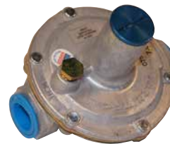
Regulador de gas