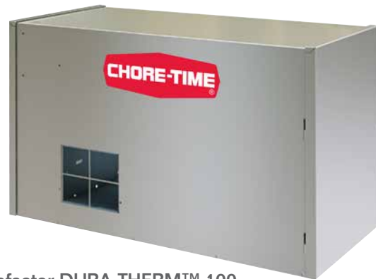
Calefactor DURA-THERM™ 100