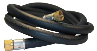
Manguera de gas