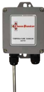
Sensor de temperatura