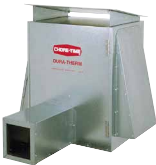
Juego de montaje para exteriores