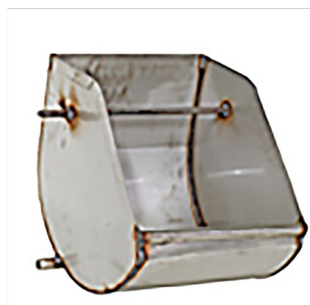
Comedero inclinable con pestillo

Los comederos de acero inoxidable para cerdas de Chore-Time están disponibles en varios diseños para acoplarse con los dosificadores de Chore-Time. Estos comederos pueden usarse también para alimentar cerdas manualmente. El diseño del comedero ayuda a evitar el desperdicio de alimento.