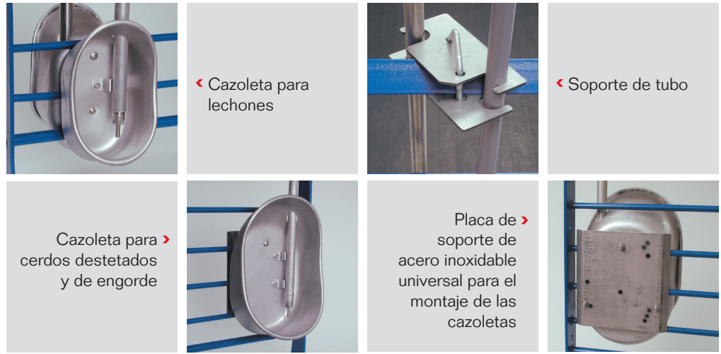
< Cazoleta para lechones