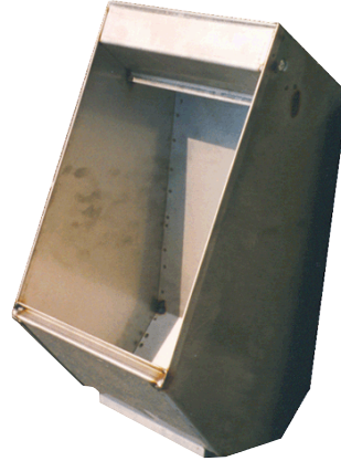
Comedero de fondo plano