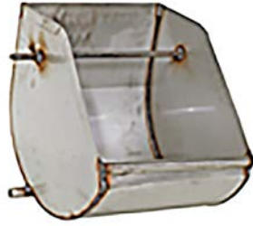
Comedero inclinable con pestillo

Los comederos de acero inoxidable para cerdas de Chore-Time están disponibles en varios diseños para acoplarse con los dosificadores de Chore-Time. Estos comederos pueden usarse también para alimentar cerdas manualmente. El diseño del comedero ayuda a evitar el desperdicio de alimento.